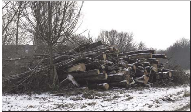
Ganz schön ausgemistet: Einige Ladungen Holz

Wir haben den Vorschlag gemacht, einen kleinen Park auf der jetzigen „Hundewiese“ zu bauen. Gegenüber den Hausnummern 32-50 und bis zu dem Weg, der zum Edeka-Markt führt, soll dieser Park entstehen. Es ist nicht notwendig, dass sehr viel Geld in die