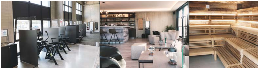
Trennwände zwischen den Geräten